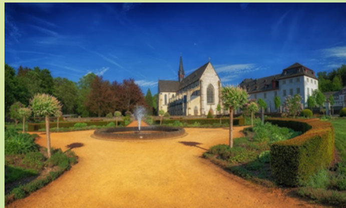
Zisterzienserabtei Marienstatt 57629 Marienstatt