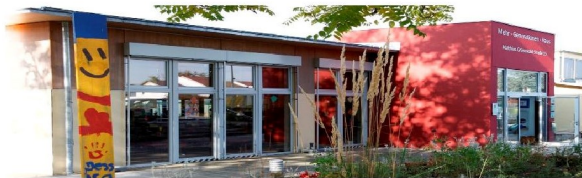
Mehrgenerationenhaus Ingelheim, Foto: Rolf Barnekow

Mehrgenerationenhaus Ingelheim (MGH) Matthias-Grünewald-Straße 15, 55218 Ingelheim