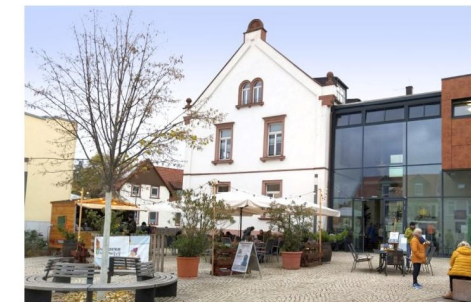
Stadtteilhaus Ober-Ingelheim