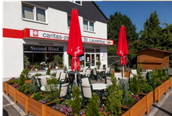
Caritas-Zentrum St. Laurentius

Montags, dienstags, donnerstags und freitags 11.00 bis 17.00 Uhr; mittwochs Ruhetag